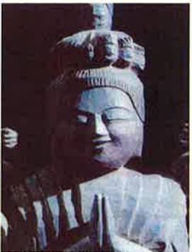
特別企画「手の匠—日本文化のうみだすもの—」