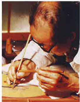
截金「西出大三・截金の美」

問合せ先:中村文化小劇場 TEL052-411-4565 名古屋市中村区中村町字茶ノ木25番地