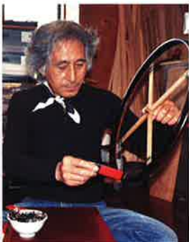
漆芸「うつわに託す-大西勲の髹漆-」

問合せ先: 緑文化小劇場 TEL052-879-6006 名古屋市緑区乗鞍二丁目223番地の1