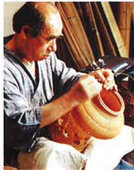
竹工芸「竹工芸・飯塚小环齋」

問合せ先:熱田文化小劇場 TEL052-682-0222 名古屋市中東区神宮三丁目1番15号