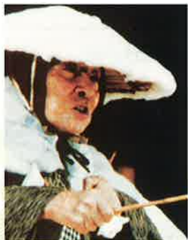
狂言「狂言師・三宅藤九郎」

問合せ先:名東文化小劇場 TEL052-726-0008 名古屋市中東区上社一丁目802番地 上社ターミナルビル3階