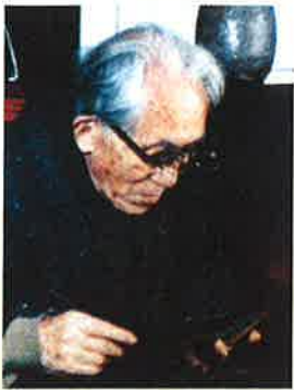
染織「芹沢銈介の美の世界」