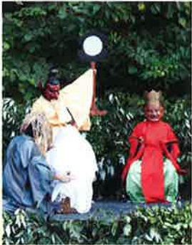
千葉「鬼来迎 鬼と仏が生きる里」

問合せ先: 中川文化小劇場 TEL052-369-1845 名古屋市中川区吉良町178番地の3