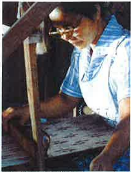
染色「芭蕉布を織る女たち—連帯の手わざ—」