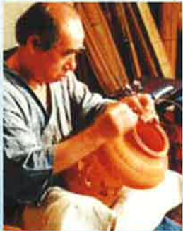
竹工芸「竹工芸・飯塚小疋齋」

問合せ先: 中村文化小劇場 052-411-4565 名古屋市中村区中村町字茶ノ木25番地