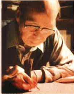
染織「山田貢の友禅-凧-」

問合せ先:中川文化小劇場 052-369-1845 名古屋市中川区吉良町178番地の3