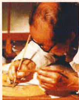
截金「西出大三・截金の美」

問合せ先:西文化小劇場 052-523-0080 名古屋市西区花の木二丁目18番23号