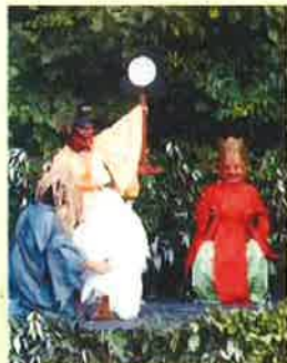
千葉「鬼来迎 鬼と仏が生きる里」

問合せ先: 守山文化小劇場 TEL052-796-1821 名古屋守山区小幡南一丁目24番10号 アクロス小幡3F