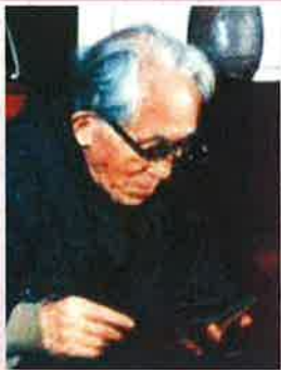
染織「芹沢銈介の美の世界」

問合せ先: 名東文化小劇場 052-726-0008 名古屋市中東区上社一丁目802番地 上社ターミナルビル3階