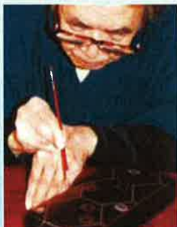
漆芸「変幻自在-田口善国・蒔絵の美-」

問合せ先:東文化小劇場 TEL052-719-0430 名古屋市東区大幸南一丁目1番10号カルポート東 4F