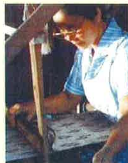
染織「芭蕉布を織る女たち-連帯の手わざ-」

問合せ先: 港文化小劇場 TEL052-654-8214 名古屋港港区港菜二丁目10番24号