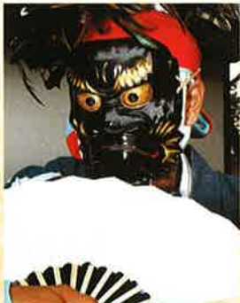
岩手「みちのくの鬼たち-鬼剣舞の里-」

問合せ先:緑文化小劇場 TEL052-879-6006 名古屋市緑区乗鞍二丁目223番地の1