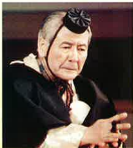
狂言「狂言・野村万蔵-技とこころ-」

昭和 cultura 小劇場 平成29年1月26日(木) 14:00上映 13:45開場 (定員310名)