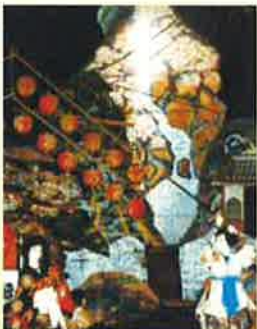
栃木「若衆たちの心意気-烏山の山あげ祭り-」

問合せ先: 北文化小劇場 TEL052-910-3366 名古屋市北区志賀町4丁目60番地の31 2階 [北図書館に併設]