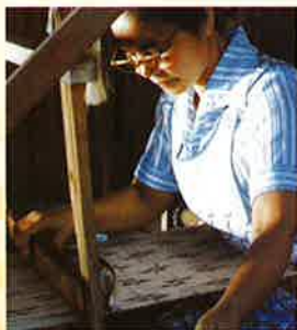
染織「芭蕉布を織る女たち-連帯の手わざ-」

名東 cultura 小劇場 平成29年2月16日(木) 14:00上映 13:45開場 (定員356名)