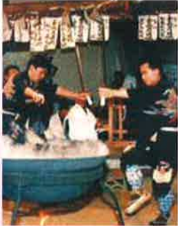
愛知「舞うがごとく翔ぶがごとく-奥三河の花祭り-」

問合せ先: 守山文化小劇場 TEL052-796-1821 名古屋市守山区小幡南一丁目24番10号 アクロス小幡3F