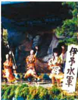
愛媛「われは水軍-松山・興居島の船踊り-」

問合せ先: 港文化小劇場 TEL052-654-8214 名古屋市港区港桑二丁目10番24号