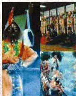
島根・兵庫「神と生きる-日本の祭りを支える頭屋制度-」

問合せ先:東文化小劇場 TEL052-719-0430 名古屋市東区大幸南一丁目1番10号カルポート東 4F