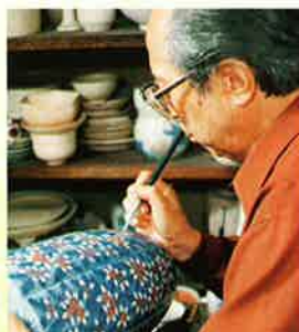
陶芸「十三代今右衛門 薄墨の美」

熱田 cultura 小劇場 平成29年3月16日(木) 14:00上映 13:45開場 (定員352名)