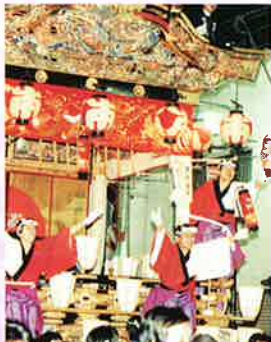
埼玉「秩父の夜祭り-山波の音が聞こえる-」

問合せ先:西文化小劇場 TEL052-523-0080 名古屋市西区花の木二丁目18番23号