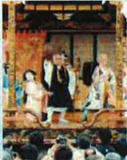
滋賀「-琵琶湖・長浜-曳山まつり」

問合せ先:南文化小劇場 TEL052-823-6511 名古屋市南区千竜通2丁目10番地の2 [南図書館に併設]