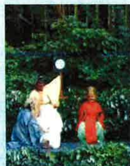
千葉「鬼来迎 鬼と私が生きる里」

問合せ先:天白文化小劇場 TEL052-806-8060 名古屋市天白区原一丁目301番地 原ターミナルビル4階